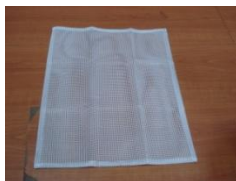
K (Filtrační rouška)