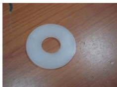
J (Plastový kroužek)