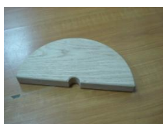
Gx2 (Drevená polkruhovú doska)