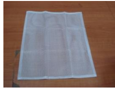
K (Filtročná rúška)