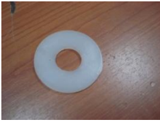
J (Plastový krúžok)