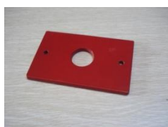
D (Stlačovacia doska)