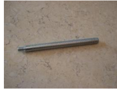
N (Stredová tyč)