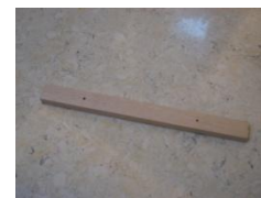
F (Časť lisovacej klece)