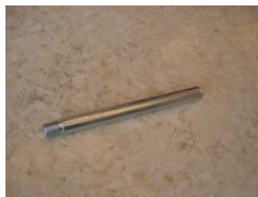
M (Středová tyč)