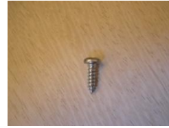
L (Nerezová skrutka)