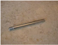
M (Stredová tyč)