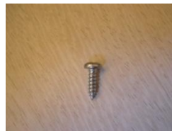
L (Nerezový šroubek)