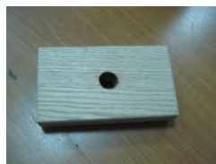
H (Dřevěná deska)