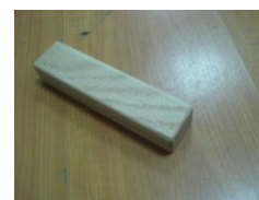
Ix2 (Dřevěný bar)