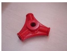
B (Matice se závitem na rukojeť)