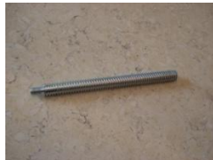
N (Středová tyč)