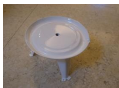
A (Stojan a miska)