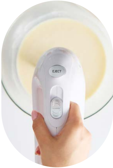
5-steps speed regulation