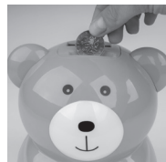
Vkládejte postupně mince do pokladničky