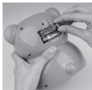
Vložte 2xAA (tužkové) baterie (dbejte na správnou polaritu)