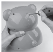
Odšroubovejte kryt baterií

Fotografie jsou ilustrační a jsou platné pro více modelů