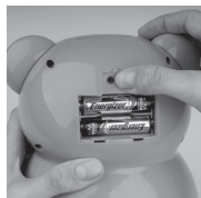
Stiskněte tlačítko RESET. Zašroubovejte zpět kryt