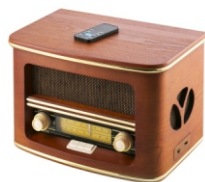
Retro radio CR 1109