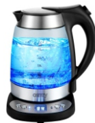
Electric Kettle CR 1242