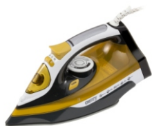
Steam Iron CR 5029