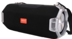
Bluetooth Speaker CR 1170