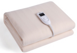
Electric Blanket CR 7407