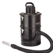
Ash Vacuum 25L 1200W CR 7030