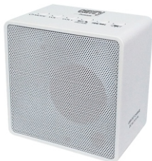
Cube Radio with bluetooth CR 1165