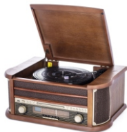
Turntable with radio CR 1111