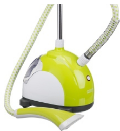
Steam Cleaner CR 5020