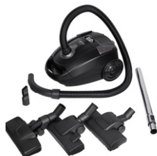
Super silent vacuum cleaner CR 7037