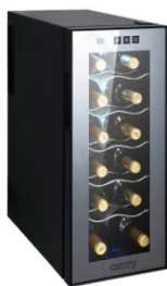
WINE COOLER CR 8068