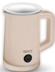
Automatic milk frother CR 4464