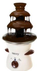
Chocolate Fountain CR 4457