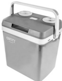
Portable Cooler CR 93