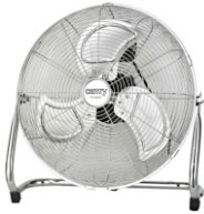
Velocity Fan CR 7306