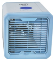
Easy Air Cooler CR 7318