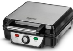
Waffle maker CR 3025