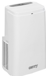
Air conditioner CR 7907