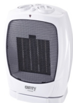
Ceramic Heater CR 7718