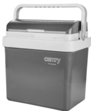
Portable cooler CR 8065