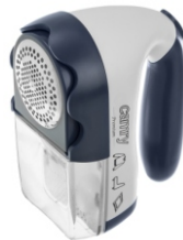
Lint remover CR 9606