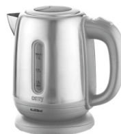
Electric Kettle CR 1278