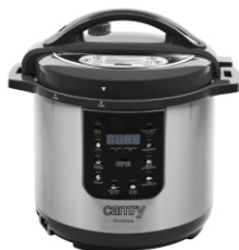
Pressure cooker CR 6409