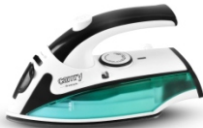
Travel Iron CR 5024