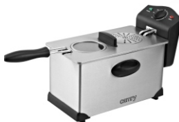
Deep Fryer 3L CR 4909