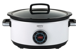
Slow Cooker CR 6410