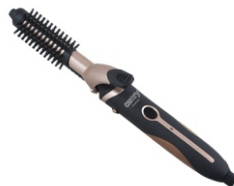
Hair styler set CR 2024