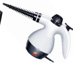
Steam Cleaner CR 7021