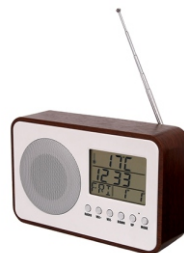
Radio CR 1153