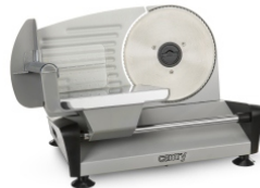
Food Slicer CR 4702