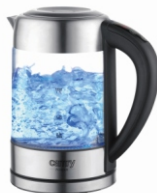
Kettle with temp. control CR 1289