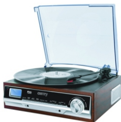
Turntable CR 1113