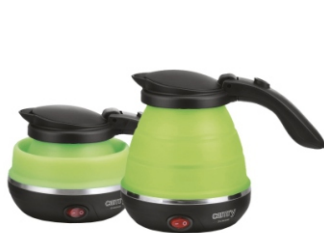
Foldable Electric Kettle CR 1265