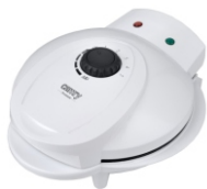
Waffle maker CR 3022