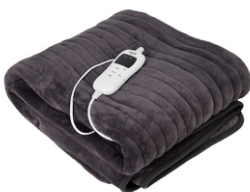
Super soft heating blanket CR 7418