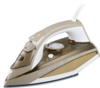
Steam iron CR 5018