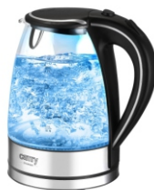
Electric Kettle CR 1239