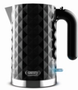
Electric Kettle CR 1169