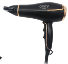
Hair Dryer CR 2255