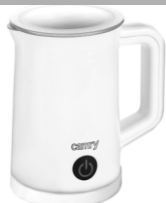
Milk Frother CR 4464