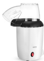
Popcorn maker CR 4458