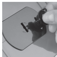
Otevřete víčko pokladničky pomocí přiloženého klíčku pootočením ve směru šipek.