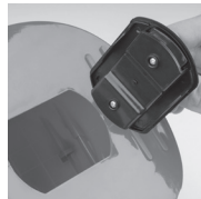
Otevřete víčko pokladničky pomocí přiloženého klíčku pootočením ve směru šipek.