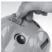
Zašroubujte zpět víčko Vložte mince (postupně) do otvoru ve víčku pokladničky