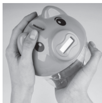
Otevřete víčko pokladničky