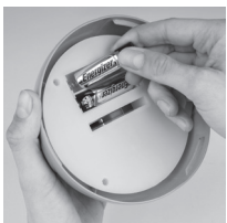
Vložte 2xAA (tužkové) baterie (dbejte na správnou polaritu)