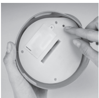
Stiskněte tlačítko RESET na spodku víčka