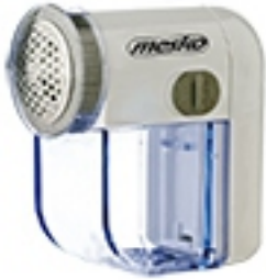
Lint remover MS 9610