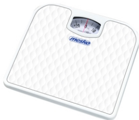
Bathroom scale MS 8160