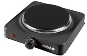
Hot Plate MS 6508