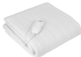
Heating Blanket MS 7419