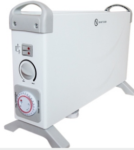
Convecter heater MS 7713