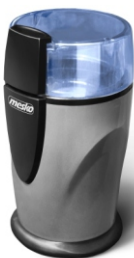
Coffee Grinder MS 4465