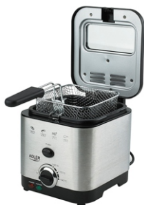
Deep Fryer 1,5L MS 4911