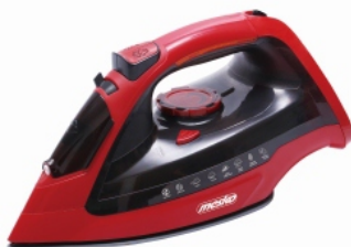
Steam Iron MS 5031