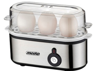
Egg Boiler MS 4485