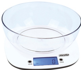
Kitchen scale with bowl MS 3165