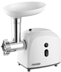
meat grinder MS 4805