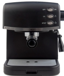
Espresso Maker MS 4409