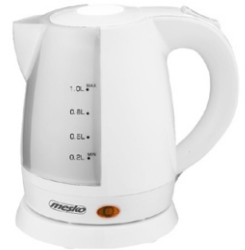
electric kettle MS 1276