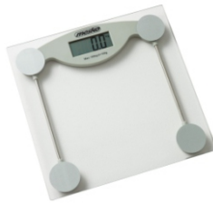
Bathroom Scale MS 8137