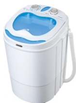
Washing machine MS 8053