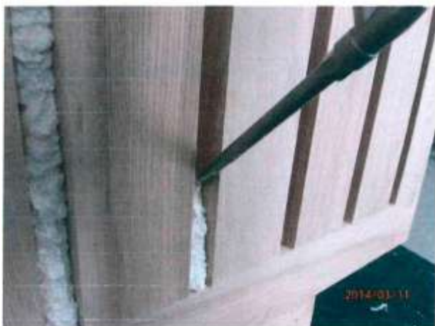
Fot. 1 Aplikace vnitřního provazce pěny (nístolí)