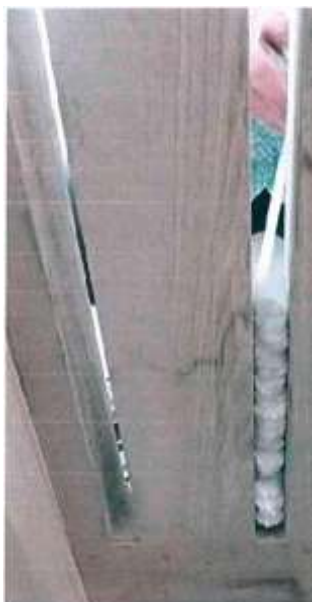
Fotografie 3. Aplikace vnitřního provazce pěny (hadičkou)