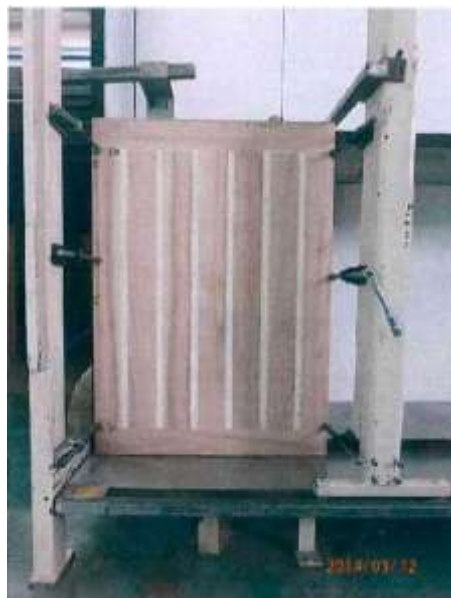
Fotografie 4. Zkušební model na stanovišti (v tlakové komoře)