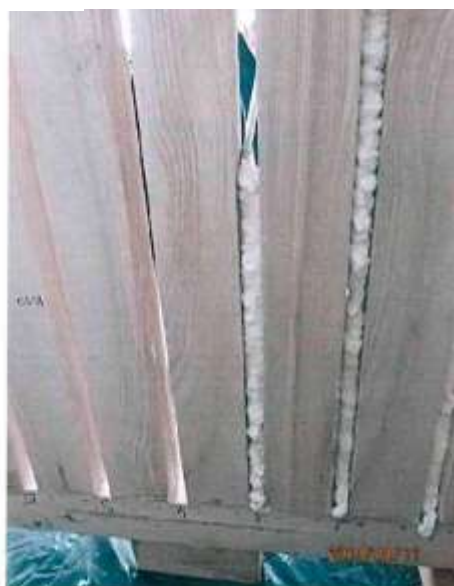
Fot. 2 Aplikace vnitřního provazce pěny (nístolí)