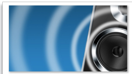
Dvoupásmové reproduktorové soustavy s konstrukcí Bass Reflex pro silný zvuk